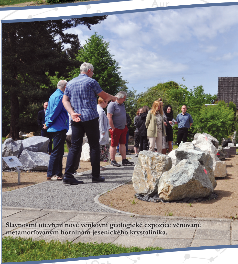
Slavnostní otevření nové venkovní geologické expozice věnované metamorfovaným horninám jesenického krystalinika.